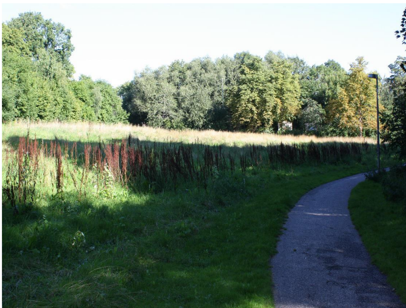
Figur 3: Lysåbent areal i fredningsområdets nordlige ende.