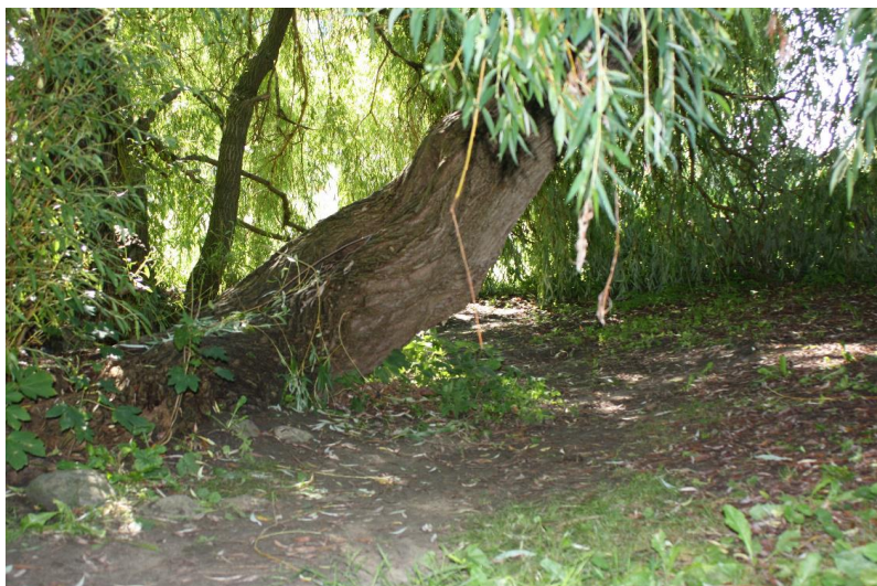
Figur 4: Hule under hængende pileløv, i fredningsområdets sydlige ende.

Fredningsområdet grænser op til tættere bebyggelse overvejende bestående af boliger, og skaber derfor ramme om en bred forankret brugerflade. Klippede græsarealer med opstillede bord- og bænkesæt giver mulighed for kortere ophold. Tillige indbyder både Ladegård Bæk, samt de bevoksede skrænter, til leg og læring. Det fremgår tydeligt, hvorledes en stor hvidpil i områdets sydligste ende, som står i kanten af vandløbet, figur 4, er flittigt brugt som hule- og klatretræ. De mange sten, der er placeret i vandløbet, bærer tillige tydeligt præg af færdsel, højst sandsynligt fra legende børn.