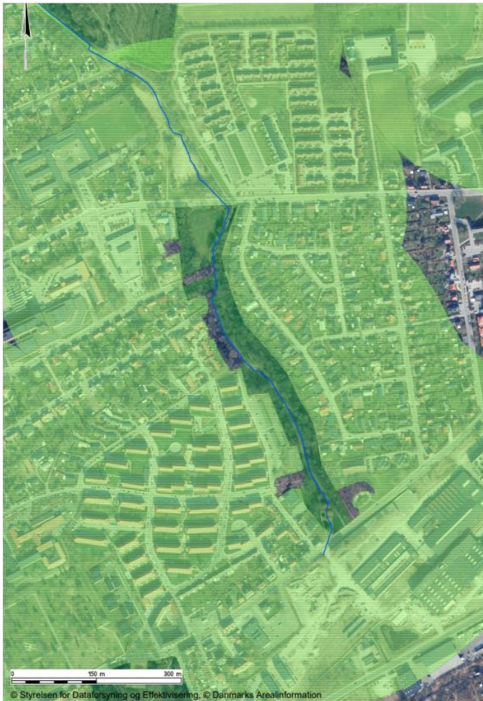
Kort 3: Mørkegrøn markering: fredskov. Blå linje; §3 beskyttet vandløb. Lysegrøn markering: skovbyggelinje.