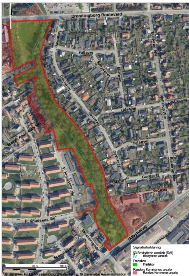
Kort 2: Forslag til afgrænsningen af fredningsområdet.