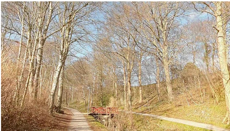
Figur 2: Google Street View af Bækkestien set mod nord, med Ladegård Bæk og hhv. cykelsti mod vest og sti til fodgænger mod øst.