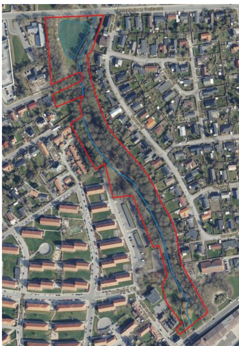
Kort 6: Placering af eventuel naturligt lignende regnvandsbassin på det åbne græsareal mod nord: blå skravering.

Der må forventes behov for klimatilpasning til håndtering af det udledte regnvand fra oplandet. I forbindelse med en evt. klimasikring og separatkloakering vil det være nødvendigt, at der kan foretages fysiske ændringer, evt. etablering af regnvandsbassin i den nordlige del af fredningsområdet, kort 6 og regulering af vandløbet på strækningen. Fredningen bør indeholde mulighed for at foretage fysiske ændringer i området til klimasikring herunder etablering af nyt naturlignende bassin.