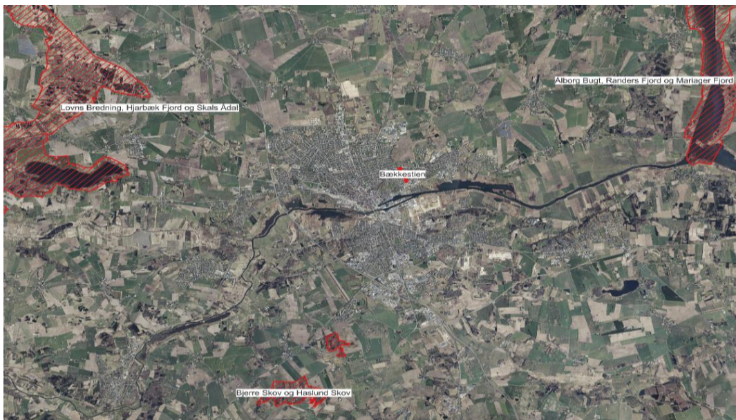
Kort 4: Oversigtskort over placering af de 3 nærmeste Natura 2000-områder i forhold til Bækkestien.