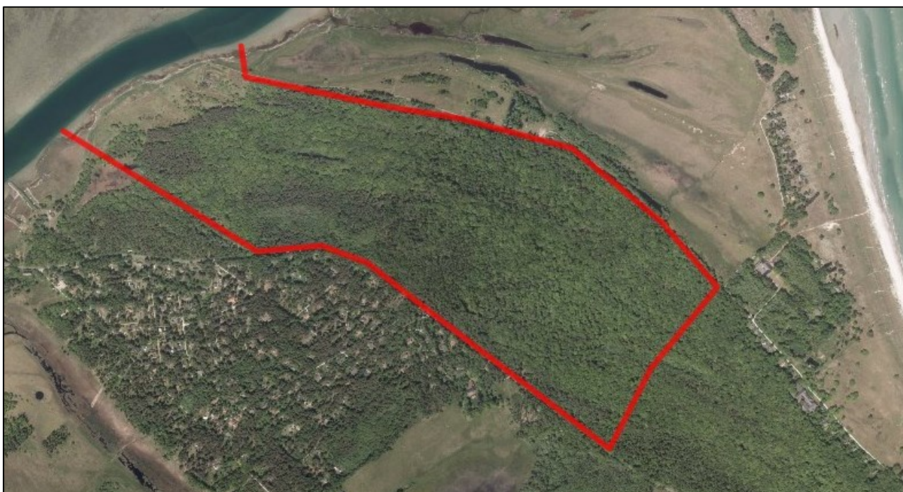
Luftfoto over fredningsområdet