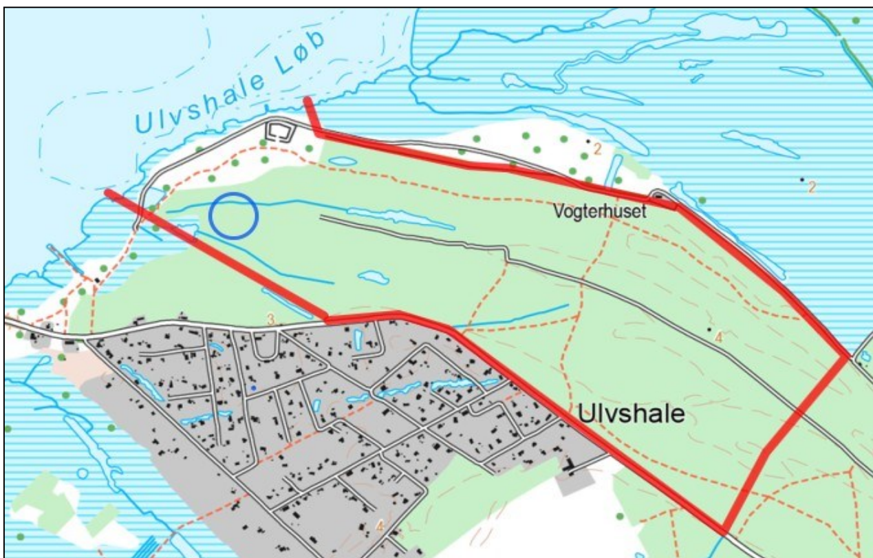
Fredningskort - fredningsgrænsen angivet med rød streg – skovfyrbevoksning markeret med blå cirkel (se § 6)