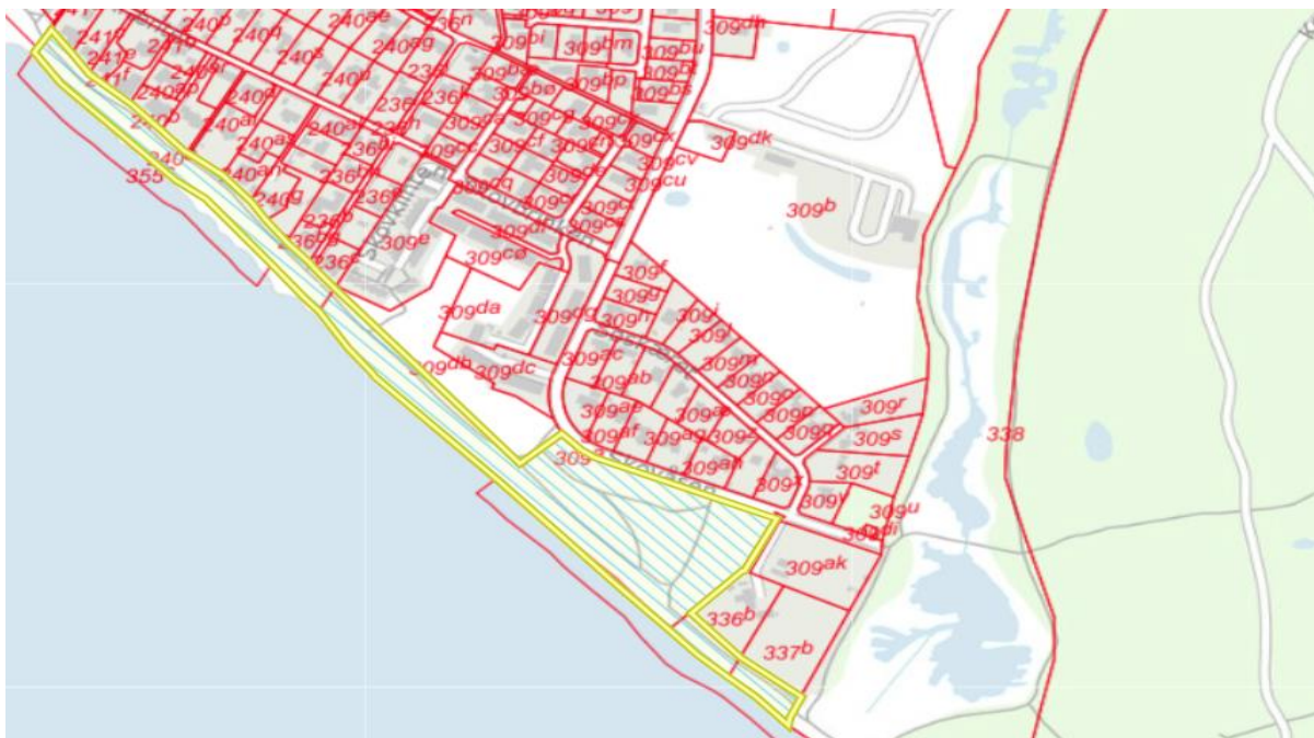
Fredede områder er vist med gult omrids og blå skravering.