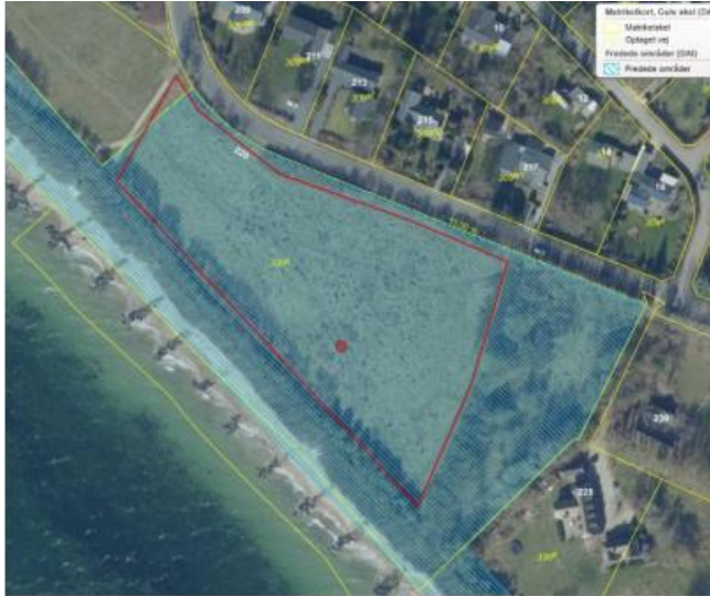
Luftfoto 2020: Den røde linje svarer ca. til hvor hegnslinjen skal gå.

Vi ønsker at opsætte totrådet kreaturhegn, hvoraf hjørnestolper og enkelte stolper bliver permanente. Selve hegnet fjernes efter endt græsning. Hegnslinjen bliver ca. som linjen markeret med rød på ovenstående luftfoto.