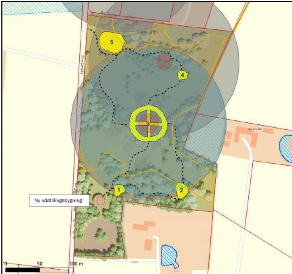
Fig. 1. Oversigt over planlagte tiltag samt arealfredninger ved Egtvedpigens Grav. Den nye udstillingsbygning befinder sig udenfor beskyttelses- og fredningszoner. Signaturer: Gul markering: planlagte formidlingsstationer (1-5). Stiplet linje: planlagte trampestier. Lys Blå skravering: Nybjerg Mølle fredning. Rød markering: fredet fortidsminde. Grå markering: beskyttet areal- fortidsminde. Gul skravering: beskyttet natur – overdrev. Placeringen af stier kan afvige en smule fra ovennævnte kortskitse, men må ikke placeres væsentlig anderledes. Der etableres kun en trappeopgang på gravhøjen og ikke fire som skitseret ovenfor.

Formidlingsstationernes placering fremgår af følgende kort: