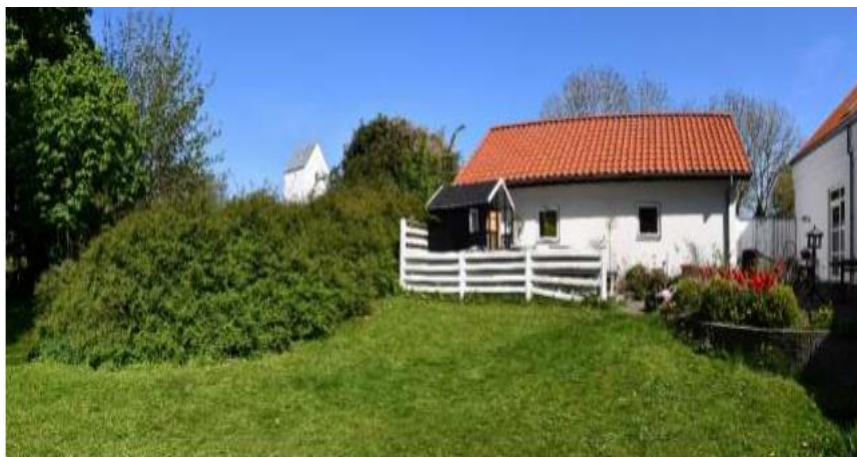
Drivhuset opføres til venstre for legehuset og syd for kirkegårdsdiget. Dele af beplantningen fjernes.

Jammerbugt Kommune har om Natura 2000- og Habitatforhold i en mail af 11. oktober 2024 udtalt følgende: