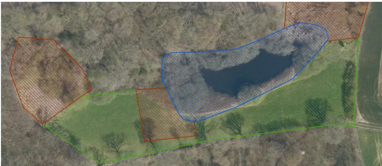
Figur 2 Beskyttede naturarealer er skravet henholdsvis med grønt for eng, rødt for mose, og blå for sø

Arbejdet foregår endvidere med en mindre gravemaskine, som vurderes ikke at påvirke græsarealerne væsentligt, da disse er faste. Det vurderes, at der er grundlag for dispensation fra naturbeskyttelseslovens § 3 til oprensning som beskrevet, forudsat at det opgravede materiale ikke placeres inden for beskyttet natur.