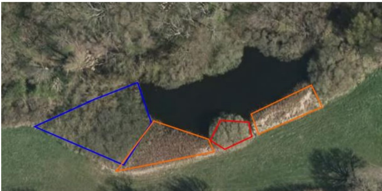
Figur 1 Arealerne med pilekrat er afgrænset med blå, tagrør med orange og grøn-pilen med rødt.

Der bliver ellers ikke ændret på terrænen, og der bliver ikke gravet eller fjernet slam i søen. Plantemateriale der fjernes fra bredden ønskes deponeret i skoven, uden for arealer beskyttet af naturbeskyttelseslovens § 3. De beskyttede arealer kan ses på figur 2.