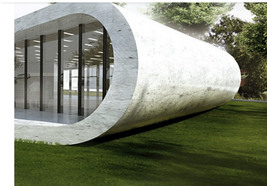
Ovenfor ses et foto af den fremtidige sognegård.

På baggrund af de foreliggende oplysninger, herunder navnlig at det nu ansøgte projekt er identisk med det projekt, som fredningsnævnet senest den 25. august 2018 har meddelt dispensation til, kan der atter meddeles dispensation til det ansøgte.