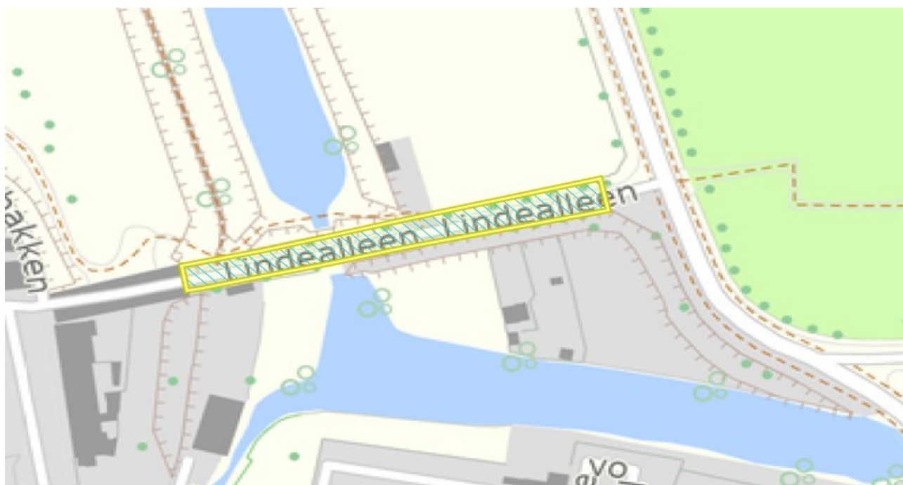
Alleen og fredningen er vist med skravering og gul streg.