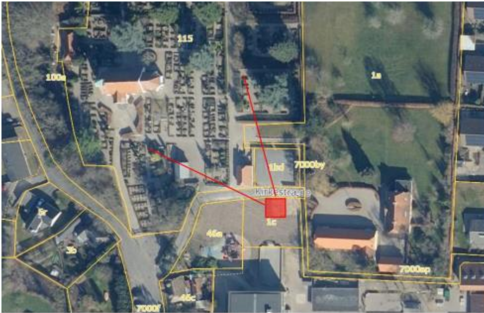
Luffoto 2022 – omtrentlig placering af affaldsgård på matr. 1c og indkigskile herfra til kirken © SFDI.

Ud fra højdekurver ses projektområdet at ligge i kote 21-22 m, og Thurø Kirke er beliggende i kote 21 m – se kort nedenfor: