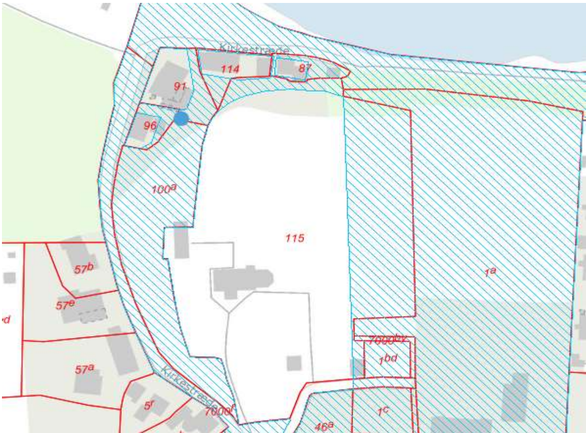
På kortet er det ansøgtets omtrentlige placering i fredningen vist med en blå prik. Fredningen er vist med skravering.