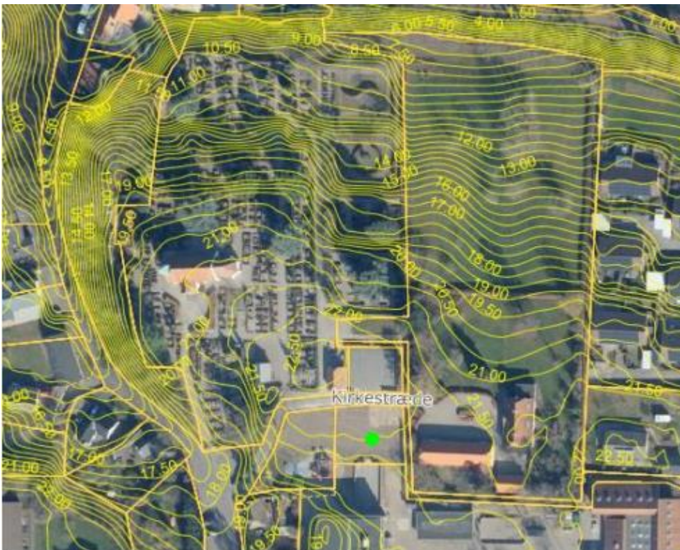
Luffoto 2022 med højdekurver, grøn prik viser projektområde

Ud fra højdekurver ses projektområdet at ligge i kote 21-22 m, og Thurø Kirke er beliggende i kote 21 m – se kort nedenfor: