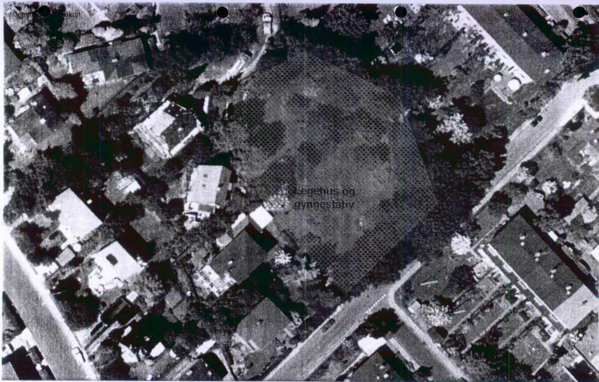
9ku Ordrup Omtrentlig placering af legehus og gyngestativ inden for fredningsgrænsen