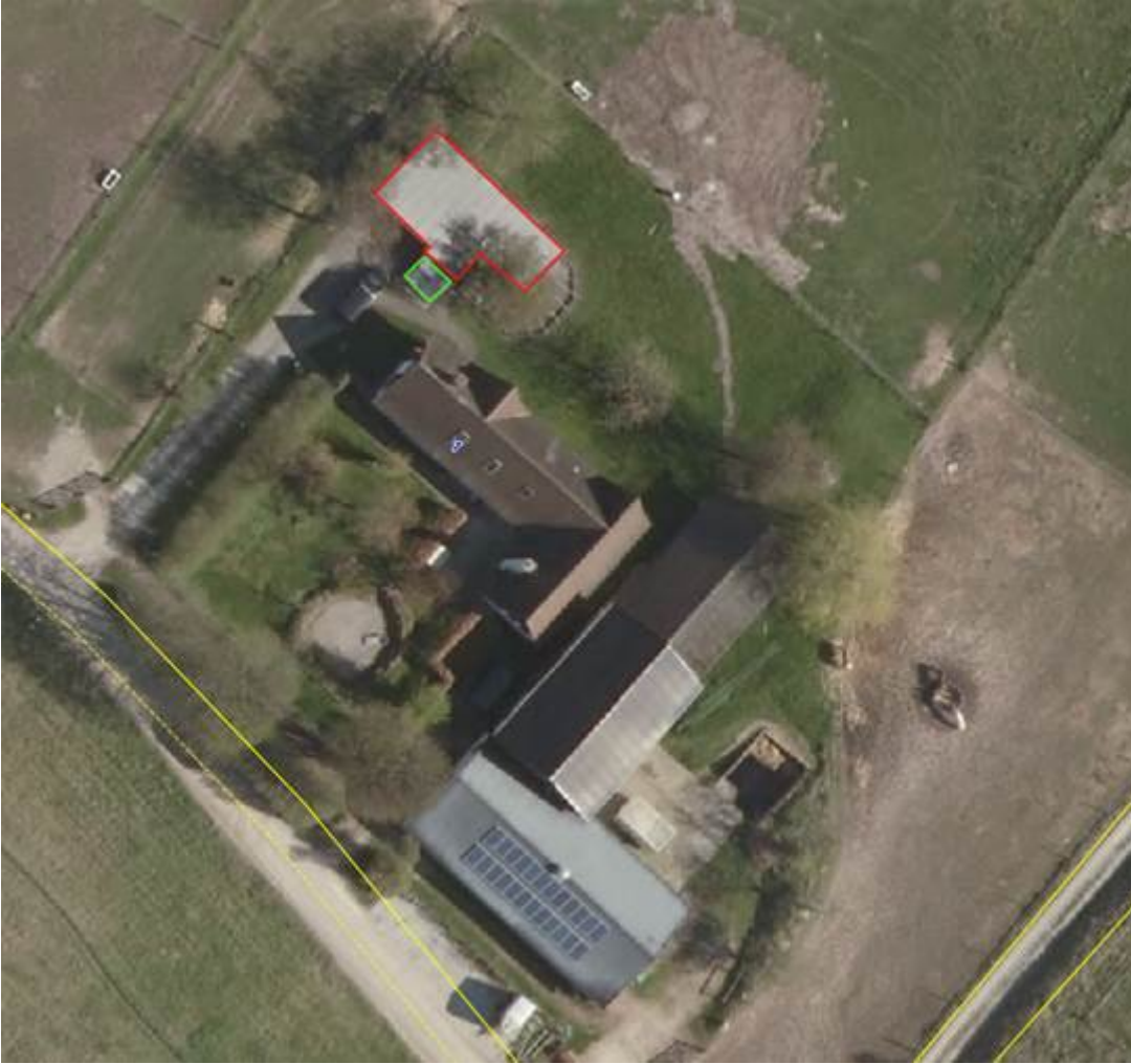
Skråfoto af bygningerne