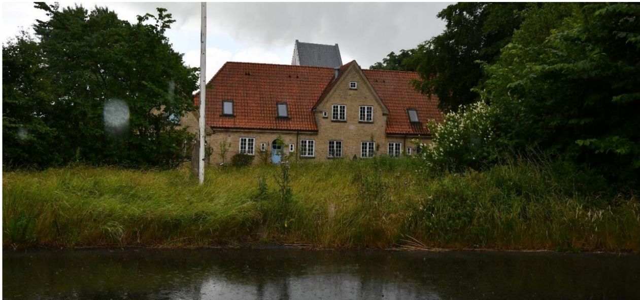
Foto 2. Set fra nord mod Anne Maries Hus med kirketårnets øverste del i baggrunden. Pavillonen opføres foran huset