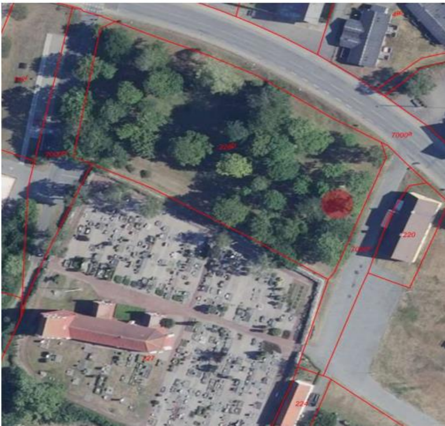
Det foreslås, at scenen opføres i området, der er vist med rød udfyldt cirkel – over for eksisterende bygning

Fredningsnævnet har ikke indhentet yderligere udtalelser i sagen.