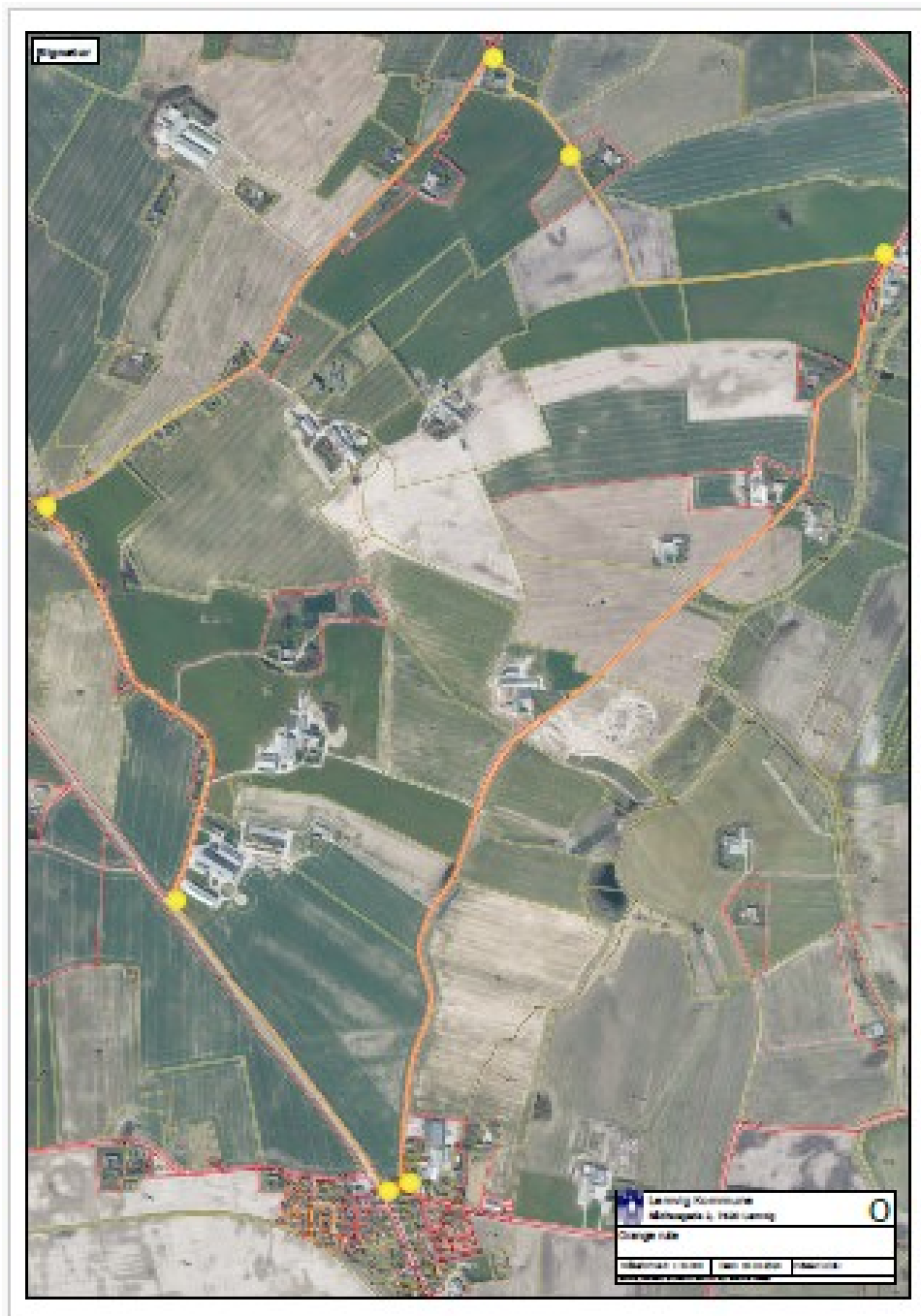
1. Kort over orange rute