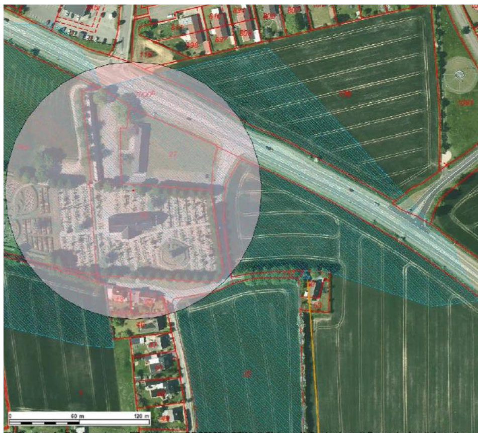
Oversigtskort med fredningens afgrænsning.

Projektet vil ikke ændre på eventuelle leve- eller ynglesteder for særligt beskyttede arter eller for rødlistearter.”