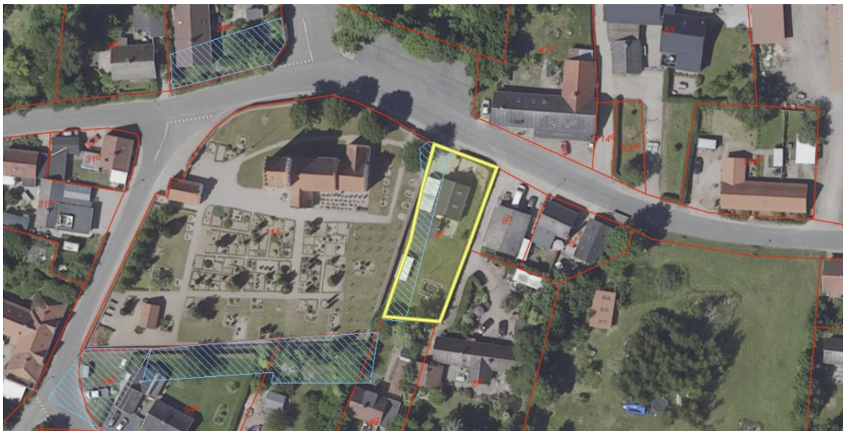
Matr.nr. 8e Hyllested By er vist med gult omrids. Fredede områder er vist med blå skravering.