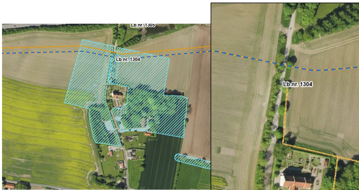
Kort 3. Baltic Pipe (blå/gul linje) krydser fredningen omkring Skellerup Kirke (lyseblå skravering) parallelt med den eksisterende gasledning (gul).

Den midlertidige mindskelse af indblik til kirken og omgivelserne, som anlægsarbejdet kan medføre i nogle få måneder, vurderes ikke at have betydning for fredningen. Anlægsarbejdet forventes vil udføres i periode november 2020 – november 2021.